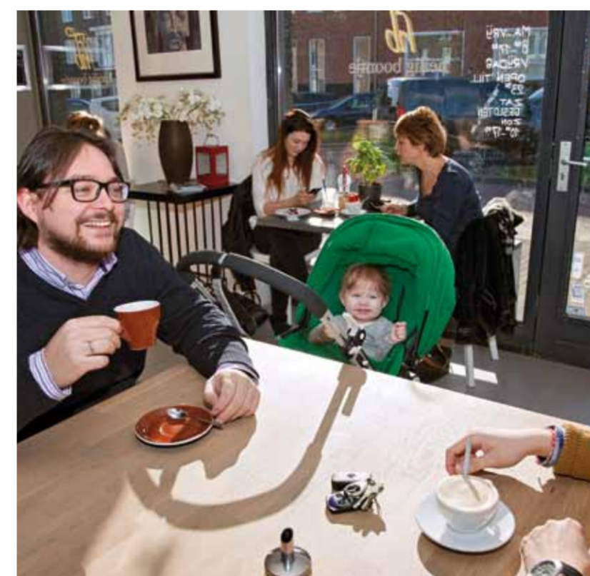
Koffiedrinken om de hoek bij Heilig Boontje, de pentagode in het park, zomerlinde.

artist impression met maximale bouwvelop